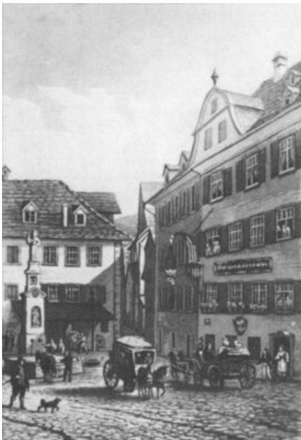
Hotel und Poststation Krone, um 1834

Weil das eingangs erwähnte Schreiben offensichtlich nicht die gewünschte Wirkung tat, wurde der badische Geschäftsträger noch in Bern mit dem Begehren vorstellig, Herwegh, der «seine auf Umsturz der bestehenden Verhältnisse gerichtete Tätigkeit» 154 weiter betreibe, endlich aus Rorschach zu verjagen. Obwohl der Bundesrat diesem Wunsch, weil die umstrittene Persönlichkeit mittlerweile Schweizer Bürger geworden war, nicht willfahren konnte, erinnerte er doch die St.Galler Behörden daran, dass es nicht ratsam sei, wenn der Verdächtige «seine Agitation gegen die Ruhe und den Frieden der der Schweiz befreundeten Staate fortsetzte und zu Klagen über Störungen der inter-nationalen Verhältnisse Anlass gäbe». 155